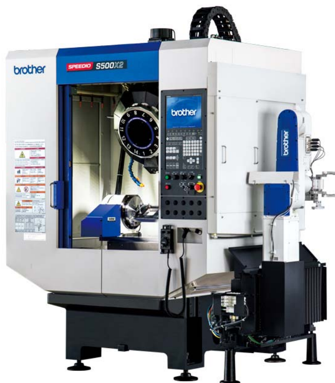
S500X2 機台搭載 BV7 自動上下料裝置